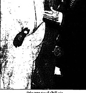
وزير الاعلام الكويتي صباح الاحمد الصباح مع سائقه في بغداد